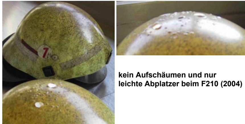
kein Aufschäumen und nur leichte Abplatzer beim F210 (2004)

Deutlich sichtbar sind zwar immer noch die Beschädigungen am F210, jedoch wurde der kritische Fehler des Aufschäumens nach innen offensichtlich beseitigt. Somit besteht die Gefahr des Zuschnürens im Kinnbereich offensichtlich nicht mehr. Auch bei den Visieren zeigte sich eine Verbesserung. F200-Visiere waren komplett verzogen und konnten nicht mehr bewegt werden, F210-Visiere lassen sich auch nach dem Training noch bewegen, jedoch ist ein Einrasten nicht mehr möglich.